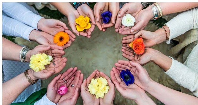
Der opstår noget kraftfuldt, når kvinder samles

Når vi begynder at fokusere på de 9 søstre, vil vi se og opleve eksempler på dem i vores hverdag. Kvinder samles på forskellig vis og i vores tidsalder er vi i gang med at heale de feminine sår op og udvikle vores bevidsthed.